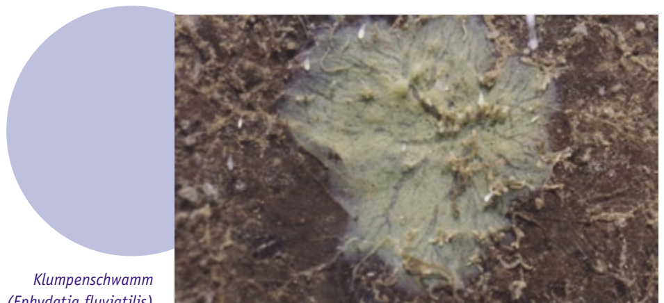
Klumpenschwamm ( Ephydatia fluviatilis )

An hellen Standorten sind die Schwämme durch eingelagerte symbiontische Algen oft grün gefärbt. Sie dienen der Ernährung und vermutlich auch der Sauerstoffversorgung. Neben den Algen bieten Schwämme auch anderen Kleinstlebewesen Lebensraum und Nahrung. Durch ihre filternde Lebensweise haben Schwämme auch einen positiven Einfluss auf die Wasserqualität.